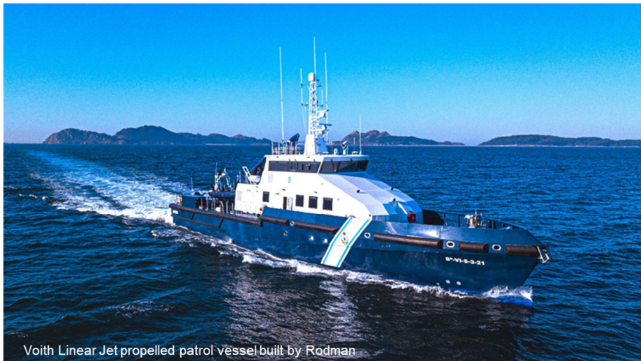
Voith Linear Jet propelled patrol vessel built by Rodman

Wir suchen: Sales Application Manager (m|w|d) Navy Marine